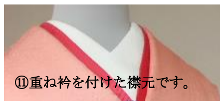
⑪重ね衿を付けた襟元です。

★着物のことでお分かりにならないことがございましたら、なんなりとお尋ねくださいませ。